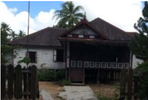
Gambar 1. Huma Hai Djaga Bahen di Desa Bahu Palawa, Kalimantan Tengah

Rumah merupakan salah satu kebutuhan pokok masyarakat, dibentuk dari aktivitas penghuninya, dan menggambarkan bagaimana kepribadian manusia yang menghuninya. Menurut (Elbas, 1986), sebelum orang-orang mengenal dengan bentuk-bentuk rumah seperti sekarang ini, orang dayak hanya mengenal satu rumah tinggal yang dinamakan Betang. Huma Hai (rumah besar) dihuni oleh satu keluarga, tinggi tiang sekitar 4 meter, panjang rumah 12 – 15 depa, lebar rumah sekitar 8 – 10 depa, panjang rumah sejajar dengan sungai.