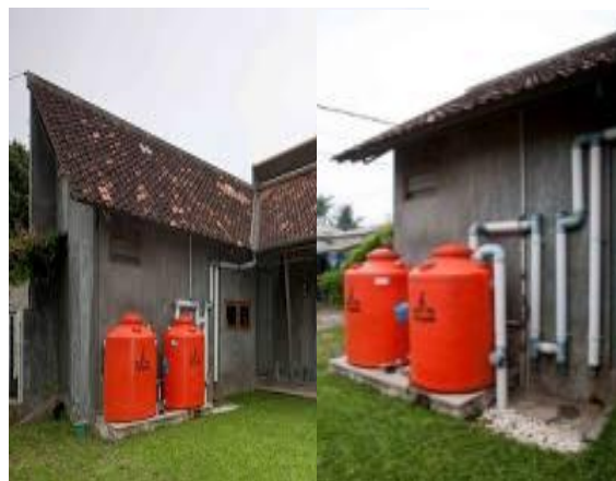
Gambar 1. Model IPAH dengan Saluran Paralon dan Tangki Plastik

Prinsip dalam pemanfaatan air hujan adalah air ditabung di musim hujan, untuk dipanen di musim kemarau.