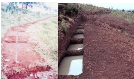
Gambar 3. Beberapa Model Rorak yang Dikombinasikan dengan Teras Gulud

Pada prinsipnya, IPAHA, sumur resapan maupun rorak berfungsi untuk menjebak aliran permukaan dan memberikan kesempatan kepada air hujan untuk terinfiltrasi ke dalam tanah.