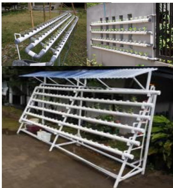
Gambar 5. Beberapa Model Media Hidroponik