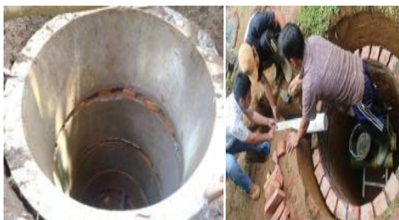
Gambar 2. Model Sumur Resapan dengan Konstruksi Bis, Batu Bata dan Corblock

Disamping IPAHA dan sumur resapan dalam program PPDM ini juga dibangun saluran-saluran buntu (rorak). Saluran buntu (rorak) merupakan saluran yang buat untuk meresapkan air melalui parit-parit yang didalamnya diberi sumur-sumur dangkal (rorak) penampung air. Pembuatan saluran berorak dengan pertimbangan bahwa jika hanya dibangun sumur-sumur resapan individu di beberapa rumah warga maka belum efektif dalam mengurangi debit limpasan yang terjadi di seluruh areal padukuhan atau desa.