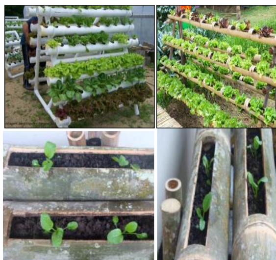
Gambar 4. Media Verticultur Berbahan Pipa Paralon dan Bambu

Cara menggunakan nutrisi hidroponik adalah sebagai berikut: (a) mengambil larutan bagian atas yang tidak ada endapannya; (b) cairan hasil fermentasi diencerkan dengan perbandingan 1 : 10 (10 bagian air dan 1 bagian); (c) menggunakan larutan untuk penyiraman atau nutrisi hidroponik; (d) menggunakan untuk penyemprotkan tanaman; (e) menggunakan ampasnya untuk pupuk organik padat/ media tanam dalam pot [18].