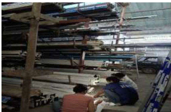
Gambar 1. Kegiatan Stock Opname di Gudang PT TAM

Kegiatan pengabdian ini dilakukan dengan menggunakan metode observasi partisipatif dan wawancara. Metode observasi partisipatif dilakukan mulai dari 10 Juni-9 Agustus 2024. Kegiatan pengabdian ini dilakukan di kantor pusat PT TAM, jalan Imam Bonjol no. 533A-Denpasar dan gudang PT TAM di jalan Buluh Indah no. 42, Denpasar. Dalam kegiatan tersebut juga dilakukan wawancara dengan Direktur, anggota divisi accounting, dan divisi gudang PT TAM. Hasil observasi partisipatif dan wawancara kemudian diolah untuk mendapatkan hasil yang maksimal tentang penerapan prosedur, manfaat, dan permasalahan dari stock opname dalam alur bisnis PT TAM. Dari permasalahan yang ditemukan maka ditawarkan beberapa solusi untuk perbaikan dalam pelaksanaan stock opname PT TAM. Adapun obesrvasi yang dilakukan secara langsung dari kegiatan stock opname pada PT. TAM yang ditunjukkan sebagai berikut: